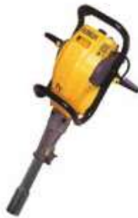
Gambar 4 Earth Hammer

Metode pemasangan batang elektroda bumi dengan cara ditekan menggunakan alat bantu berupa Earth Hammer, sehingga batang elektrode pembumian dapat menempel secara erat dengan tanah.