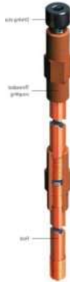
Gambar 3 Elektroda Pembumian

Metode pemasangan batang elektroda bumi dengan cara ditekan menggunakan alat bantu berupa Earth Hammer, sehingga batang elektrode pembumian dapat menempel secara erat dengan tanah.