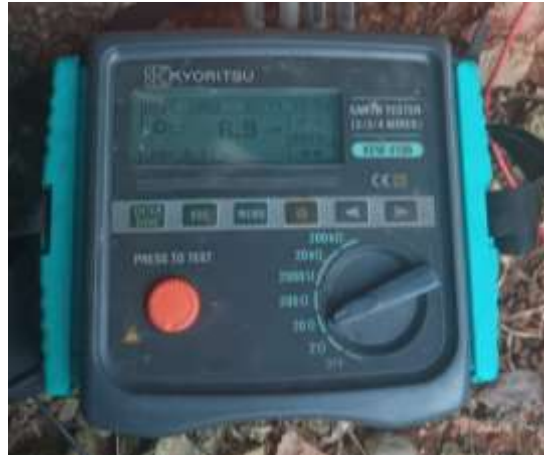
Gambar 1 Alat Ukur Hambatan

Hasil dari pengukuran yang telah dilakukan didapat nilai hambatan terukur pada alat ukur sebesar 0,11 \Omega dan nilai tahanan jenis tanah 6,9 \Omega .m.