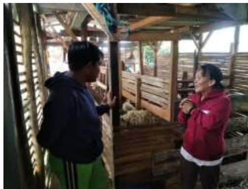
Gambar 1. Wawancara dengan pembuat pupuk kandang

Pengumpulan data dibagi menjadi dua yakni primer dan sekunder, Data primer yang dikumpulkan diperoleh dari hasil pengamatan langsung di lapang dan wawancara. Data diperoleh dengan cara langsung di lapang, data yang didapat secara langsung ini menggunakan cara membandingkan antara tanah yang di berikan pupuk kandang dengan tanah tanpa di berikan pupuk kandang. Pengambilan data juga dilakukan melalui diskusi dengan pihak-pihak terkait, seperti dengan ceo perusahaan, petani yang mengelola dan juga beberapa pihak pendukung lainnya.